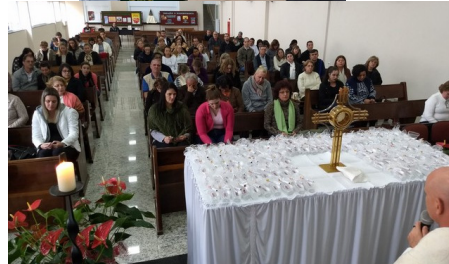
Enc. Comunit. de Espiritualidade - 04/08