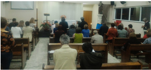
Terço Vocacional - 15/07