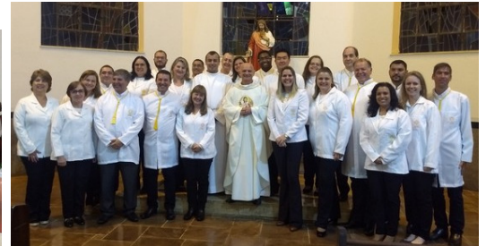
Investidura dos Novos Mesc - 06/08