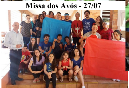
Gincana Legião de Maria - 28/07