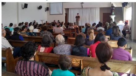
Enc. dos Avós - 27/07

Por intercessão de São Judas Tadeu, Deus abençoe sua generosidade