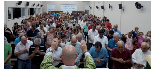
Celebrações da Semana da Família