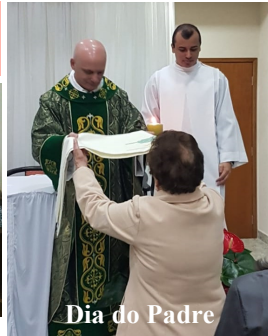
Dia do Padre