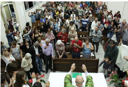
Missa dos Avós - 27/07