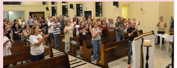
Comissão da Assembleia

Nossa gratidão a todos os que participaram, especialmente aos coordenadores de cada pastoral e comunidade, à Pastoral Vocacional e à Comissão da Assembleia que organizaram este momento de comunhão e participação, em vista da missão.