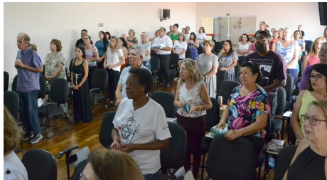
Enc. Espiritualidade Advento - 02/12