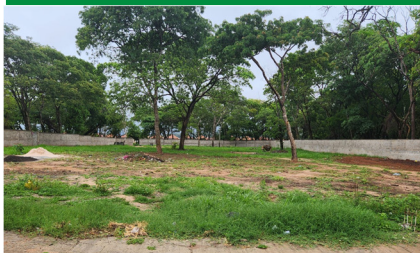
Terreno onde será construída a Igreja do Bom Pastor

A cultura individualista que nos cerca nos incita a vivermos fechados em nosso pequeno mundo; e isso pode acontecer também com a Igreja. Podemos ser uma Paróquia voltada para si mesma, apenas atenta às próprias necessidades, ou podemos ser uma Paróquia que percebe as necessidades de outras comunidades. Na XVIII Assembleia Paroquial de Pastoral, nossa Paróquia tomou uma importante decisão: doar a renda das festas deste ano (Show de Prêmios, Festa Junina e Festividades do Padroeiro) para o início da construção da Igreja do Bom Pastor, num terreno localizado entre o Jardim Zavaglia e o Abdelnur. Trata-se de uma região de São Carlos com uma grande população católica que ainda não conta com um local adequado para a celebração da fé. Nossa Paróquia ajudará a dar início à essa construção tão importante para a nossa Igreja. Para os nossos irmãos católicos que moram naquela região da cidade, a Igreja do Bom Pastor será um sinal de esperança, animando a missão. E também o gesto de nossa paróquia quer ser um grande sinal de esperança neste mundo fechado pelo egoísmo. Você pode fazer parte deste "sinal de esperança", seja colaborando generosamente com as festas que a nossa comunidade vai realizar neste ano, seja com sua fidelidade na devolução do Dízimo mensal, para que tenhamos receitas suficientes para o sustento da missão da nossa Paróquia e a ajuda ao próximo. Seja você também um sinal de esperança!