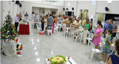
Confraternização comunitária - 30/11