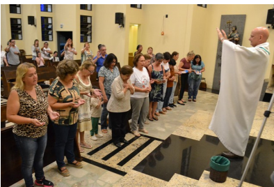
Abertura Novena de Natal - 29/11