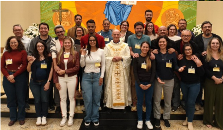
Missa Sta. Rita 22/05