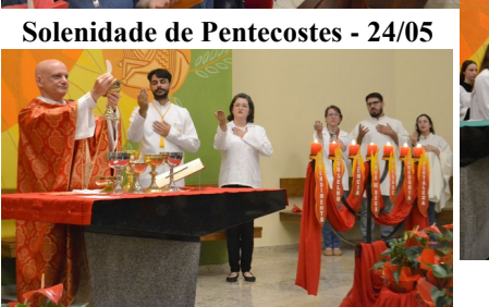
Solenidade de Pentecostes - 24/05