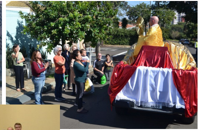
Solenidade de Corpus Christi: procissão, Sete Horas para Jesus e Missa com Adoração e renovação dos Mesc - 04/06