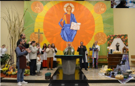
Missa Sertaneja e em louvor a Santo Antonio e Festa Junina 12 e 13/06