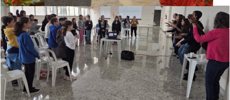
Manhã Catequética - 20/06