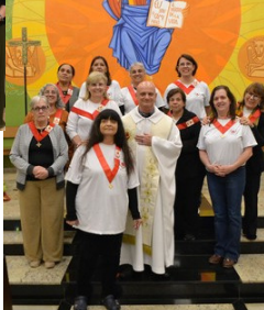
Solenidade do Sagrado Coração de Jesus - 12/06